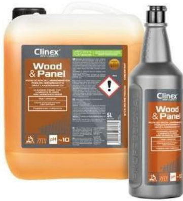
Clinex Wood & Panel