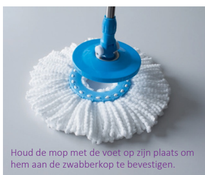
Houd de mop met de voet op zijn plaats om hem aan de zwabberkop te bevestigen.