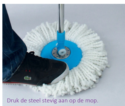
Druk de steel stevig aan op de mop.